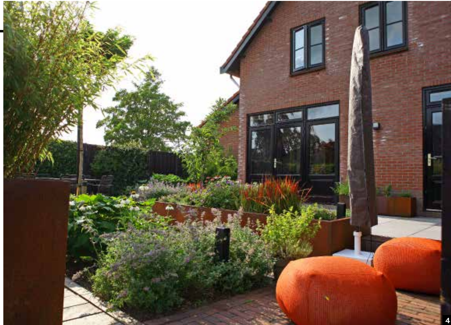
4 Beplanting tot dichtbij het huis: zo geniet je binnen ook van de tuin.